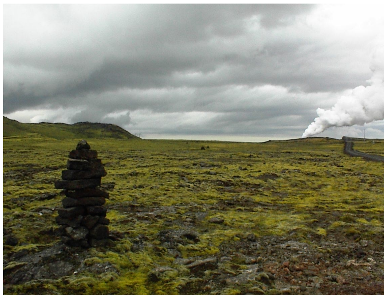
Mynd 1. Hellisheiðarvegur. Horft til vesturs. Myndin sýnir vörður sem liggja norðan Gígahnúks.

Gígahnúkur. Fyrirhugað er að reisa stöðvarhús austan Gígahnúks og lögn þaðan til norðurs. Engar minjar eru sýnilegar á byggingarreitnum né þar sem lögninni er ætlaður staður. Hinsvegar myndi lögnin liggja þvert á Hellisheiðarveg, sem er varðaður á þessum slóðum og liggur um Orustuhólshraun til vesturs að Hellisskarði og Kolviðarhóli.